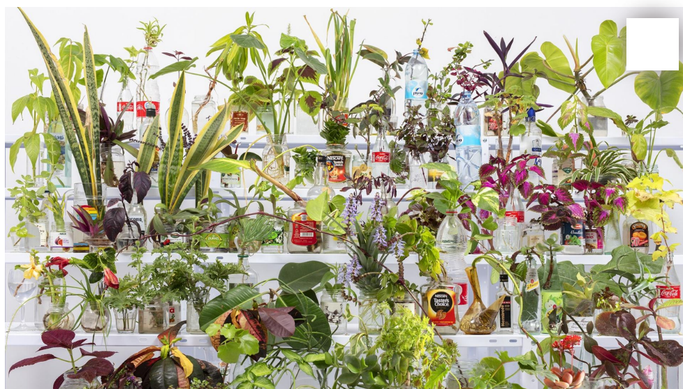
מתוך התערוכה