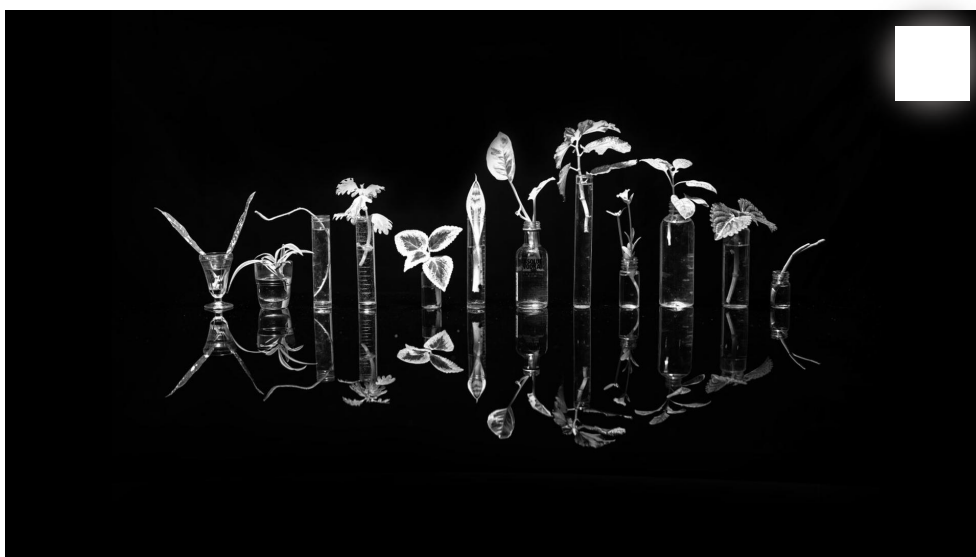
מתוך התערוכה

"אני לא מחשיב את עצמי כאחד שנושא דגלים. בחיים האישיים שלי אני לא זורק זבל אורגני כבר עשר שנים כי הכל הולך לגינה, ובכלל אני משתדל לא לזרוק כלום אלא לחלק לאחרים. אז באותה מידה אני נהנה לתת לאנשים את הצמחים, לחלק להם אותם בחינם ושיבינו את העיקרון. מה שאני עושה הן פעולות פשוטות שהרבה אנשים בעיר או בארץ עושים גם. זה נראה לי רק הגיוני שאם 60-70 אחוז מהזבל שלנו הוא זבל אורגני, אז עדיף להחזיר אותו חזרה לגינה. אני לא גרטה טונברג, אבל נחמד לי שהפעולות האלה נעשות כל הזמן גם בלי קשר לעבודה האמנותית שלי, ושכל מי שיוצא מהבית או הסטודיו שלי יוצא עם צמח, בחינם".