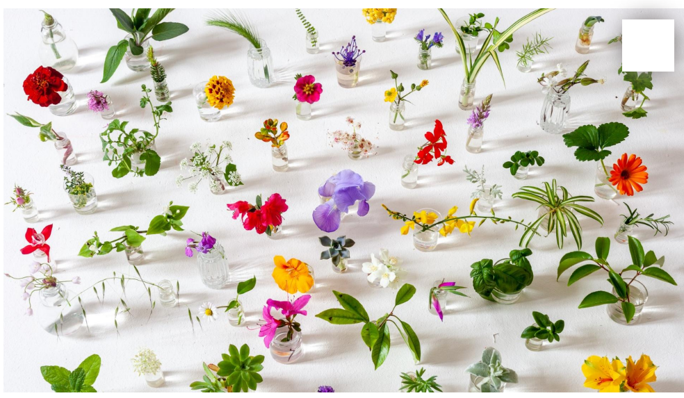
מתוך התערוכה

יותר ממה שהעין האנושית מצליחה לראות. אני מנסה להראות את הצמחים הכי טוב שאפשר. חשוב לי שיראו כל שורש קטן או כל עלה שנבל. זה הבסיס הכי הכי בסיסי. וכמו שהם מושכים אותי - ככה הם באים לידי ביטוי בצילומים. כשלימדתי (בעבר, בבצלאל, מנשר, אוניברסיטת חיפה), הסטודנטים היו אומרים מדי פעם שהם מפחדים לצלם דברים 'רגילים'. מה שהייתי מסביר תמיד הוא שברגע שאתה, הצלם, מספיק מתעניין ומספיק מתרגש ממהו, אתה מספיק תקפיד עליו כך שגם מי שיסתכל על הצילום ירגיש את אותו הדבר. וכן, לפעמים גם צריך לצלם מאה צילומים כדי שייצא אחד מדויק".