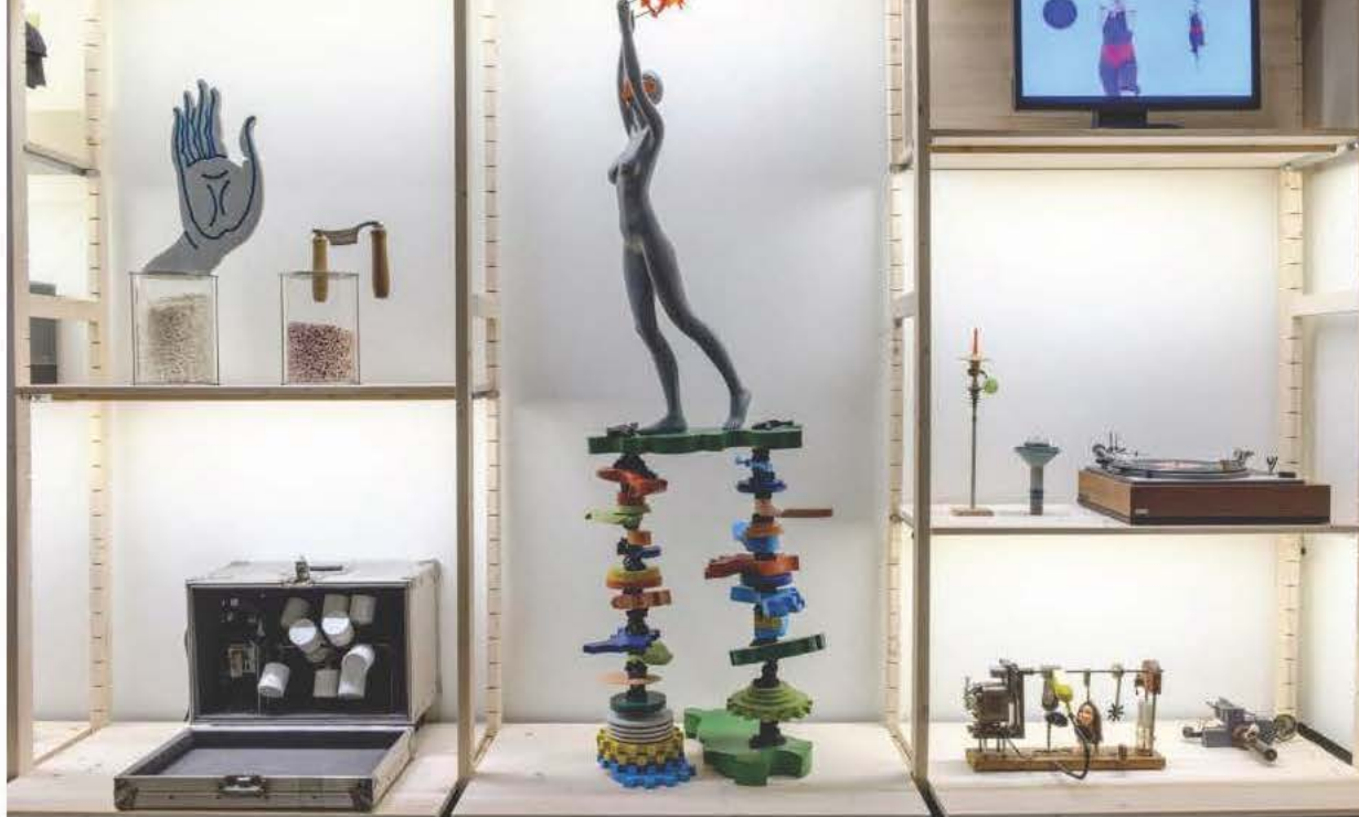
מראה הצבה של התערוכה "The Institute of Ongoing Things", במוזיאון ההיסטוריה היהודית באמסטרדם