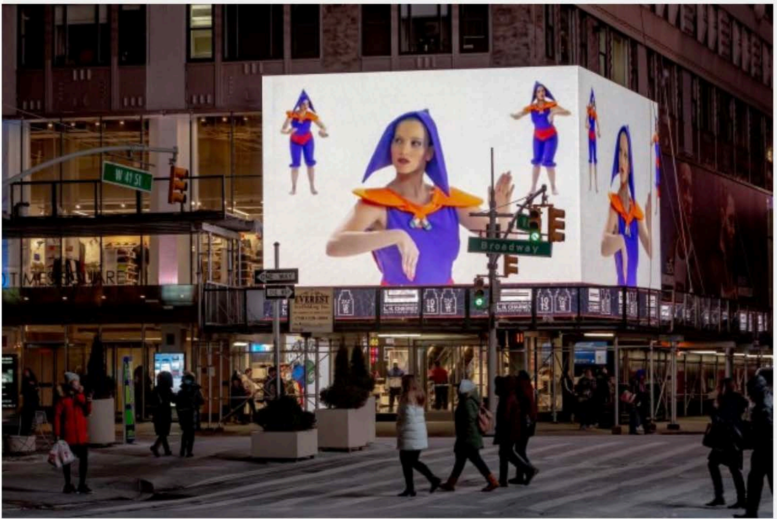
(ZAZ10TS, image by Zdravko Cota (119 2019 ©)