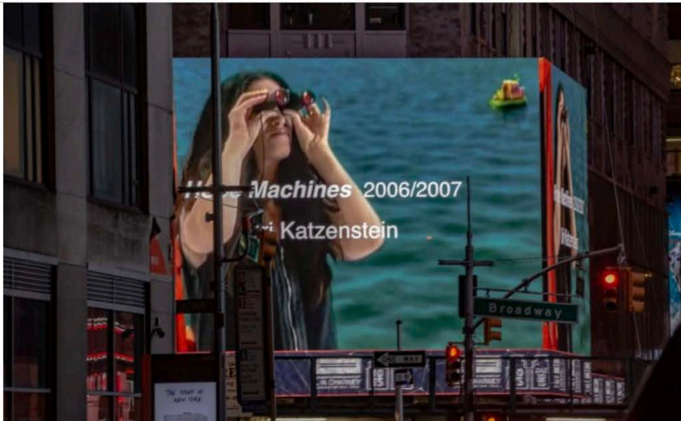
(ZAZ10TS, image by Zdravko Cota (126 2019 ©)