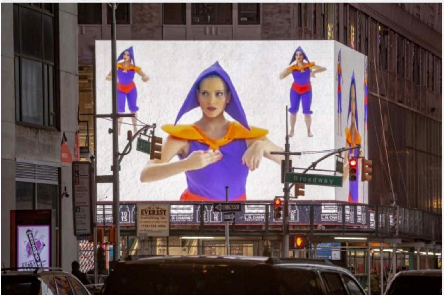
(ZAZ10TS, image by Zdravko Cota (124 2019 ©)